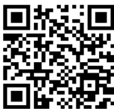
QR Code สมัครเข้าอบรม TRT Coordinator